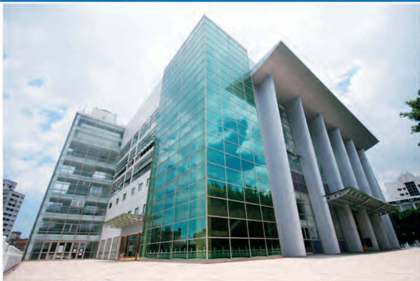
淡江大学绍谟体育馆