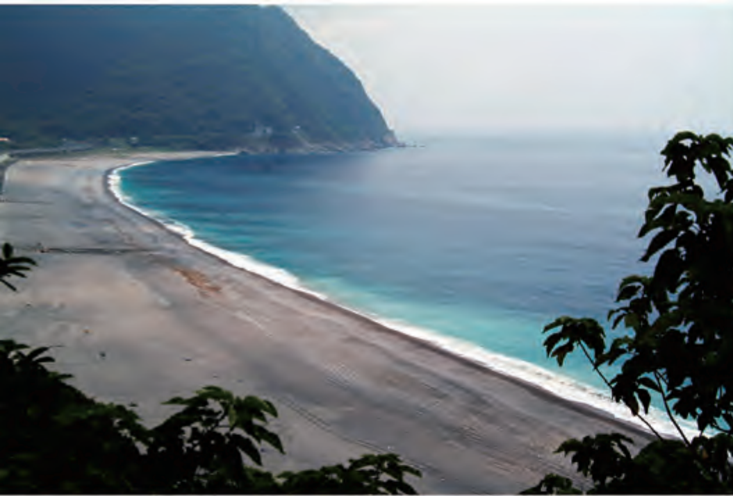
花莲清水断崖 清水断崖位于台湾花莲县往宜兰县的苏花公路上沿线海岸线非常壮丽迷人 观光客由东部时必去的景点之一