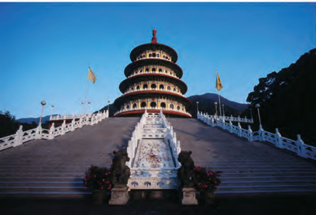
淡水天元宫 天元宫每年樱花绽放，吸引许多人潮前来赏樱