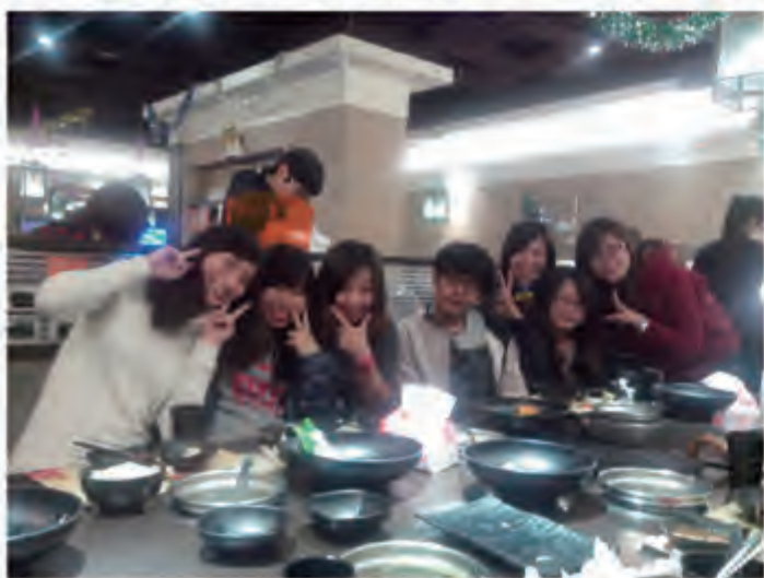
陆生与本校学伴一起享用美食