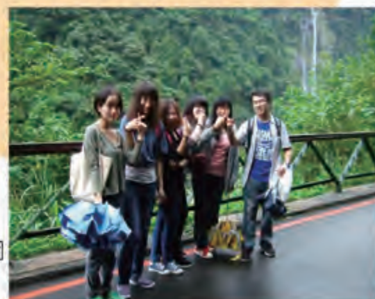
陆生探索台湾之美-花莲太鲁阁