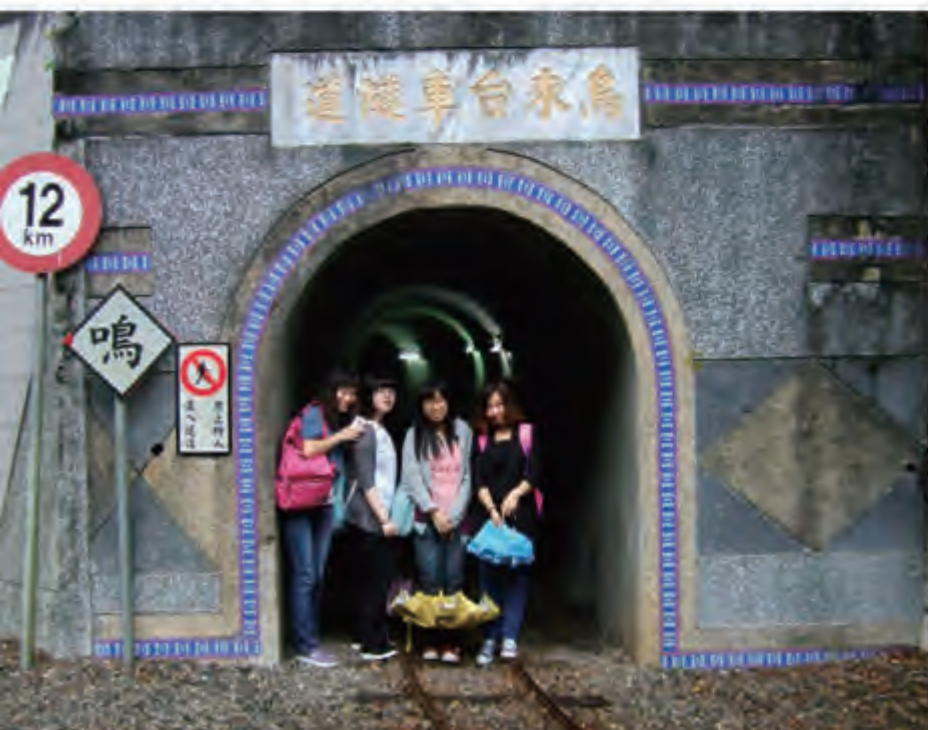
陆生与学伴同游新北市景点·乌来自由广场一景