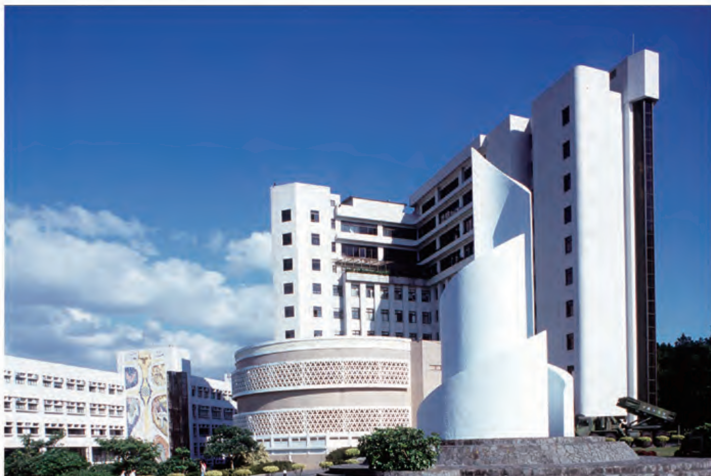
淡江大学书卷广场与惊声大楼